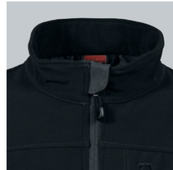
Kinnschutz am Stehkragen