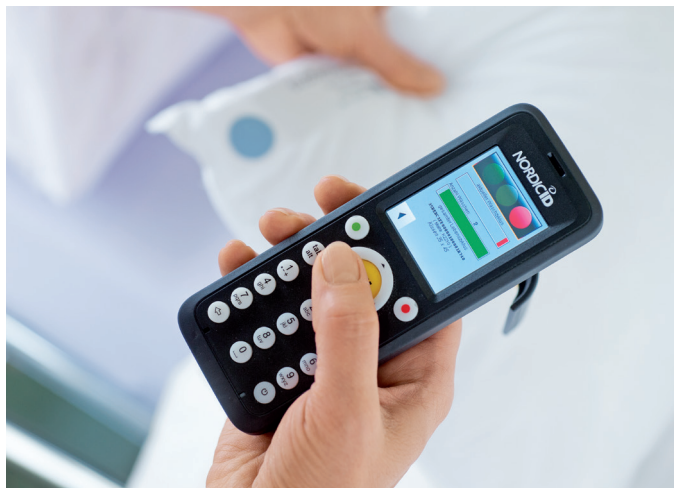
Mobiles Lesegerät zeigt

Mit HyCS 2.0 kann jedes Spital und jedes Heim Hygiene und Wirtschaftlichkeit in Einklang bringen.