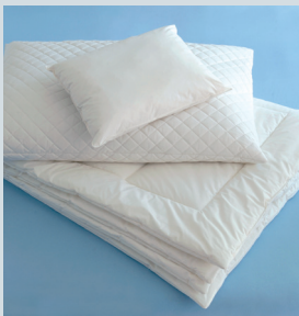
Duvets und Kissen