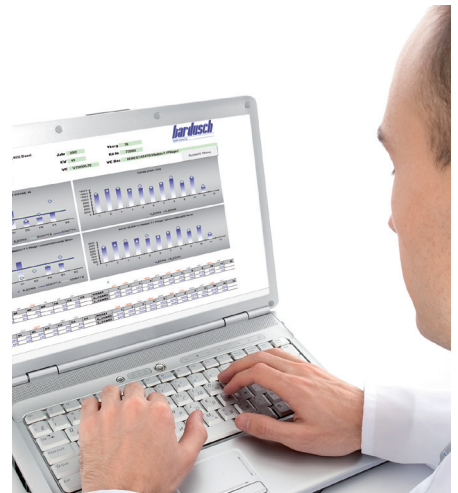
Planung und Optimierung der Aufbereitungskosten