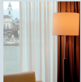
Vorhänge und Storen